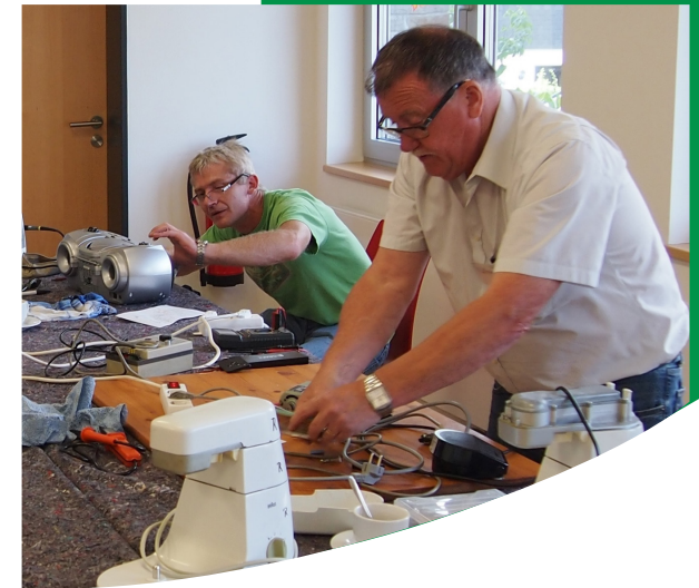
LSUdE_F-181017-1-repaircafe-lindlar/ Fotos: Repair-Café Engelskirchen und Jubilate Forum Lindlar